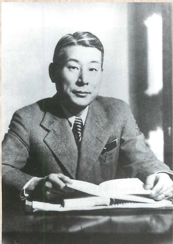
NPO法人杉原千畝命のビザ所蔵